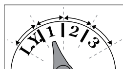
1 ano desde o ano bissexto

P. ex.: quando se define junho de 1 ano desde o ano bissexto anterior